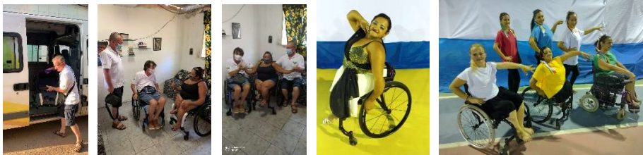
Nina à qui

A la fin 2021, et cela depuis le début de la Fondations des Roues de la Liberté, nous avons aidé plus de 346 personnes avec leur famille, pour un total de 512 donations de divers matériels orthopédiques.